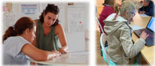
Búsqueda de empleo/ Apoyo escolar